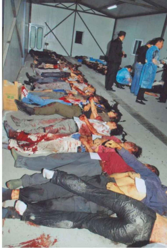
Resim 1: 2008 Urumçi Olaylarında Öldürülen Uygur Kardeşlerimiz

dolayısıyla, kendilerinin Çin işgali altında olduklarını çeşitli eylemlerle dünya halklarına hatırlatmaya başlamışlardır. 2008 yaz aylarında patlak veren Urumçi olayları bir dönüm noktası oldu ama tam olarak neler yaşandı bilemiyoruz. Bunun en büyük nedeni, Çin'in bölgeden her tür iletişimi kapatması ve internete bile izin vermemesidir. Çinli yetkililer bu olaylarda 156 Uygur Türkünün öldüğünü kabul etse de, doğru rakam bunun muhtemelen 3-4 katıdır. Türkiye'de Uygur Türklerine ait dernekler yaptıkları açıklamalarda en az 500 kişinin öldüğünü söyledi. Binlerce yaralı ve bir o kadar da tutuklu bulunduğu Çiniler tarafından da kabul edildi. Yayınlanan fotoğraflarda elinde çivili sopalarla Çinli erkeklerin Urumçi sokaklarında dolaştığı görüldü. Türkiye'deki çeşitli Uygur Türk derneklerinin açıklamalarına göre, Çin'in güneyindeki bir sanayi şehri olan Guangdong'da bir fabrikada Türklerin kaldığı yatakhane Çin polisi ve yerel halk tarafından basılmış, yüzlerce Uygur Türkü öldürülmüştür (Resim 1). Bu olayları Urumçi'de protesto eden Türklerin üzerine ise otomatik silahlarla ateş açılmış, açık katliam ve peşi sıra etnik temizlik bugün de yaşanmaya devam ediyor.