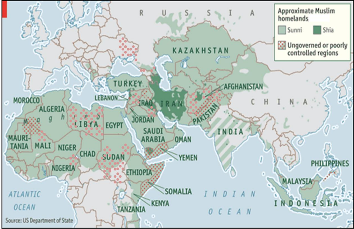
Harita 1: İslam Dünyası ve Karanlık Bölgeler

Tıpkı 11 Eylül saldırıları gibi Arap Baharı da bu safhanın strateji değişikliklerine yol açan önemli bir evresi oldu. 2011'in başında tetiklenen Arap hareketleri ile İslamcılarının son dönemi başladı. Ancak, zamanın şansı olarak görülen ılımlı İslam ile Siyasal İslamcılarının gerçek yüzlerinin çok farklı olduğu anlaşıldı. İlimli İslam, çok çabuk radikal bir şekil alabiliyordu. Radikal İslam'dan daha tehlikeli olan Batının ılımlı İslam diye kurguladığı ve laik devletleri ele geçirmeye başlayan İslamcı siyasi partiler ve hareketler oldu. Bunlar, bugüne kadar sağlanabilmiş tüm modernist ve laik gelişmeleri tersine çevirdiler. Ortadoğu politikasında liberal, laik, milliyetçi kesimler yenildi ya da marjinalize edildi. İslamcılara göre; "Çare İslamdı" ama bu İslam anlayışı modernite ve demokrasi için gelmiyordu. Ne tür bir İslam olduğunun da cevabı bugün de yok. İslami bir toplum yaratabilmek için devlet güçlerini kullanabilme olasılığı İslamcılara her zaman cazip gelmiştir. Mısır'da, Mursi'nin devleti ele geçirme gayreti tehlikeyi önlemede tereddüt etmeyen askerler tarafından önlendi. Modern olan her şey; kıyafetlerimiz, yaşam tarzımız, kültürümüz geriye gidiyor, düşünce ve davranış biçimlerimiz değişmeye zorlanıyor. Üstelik İslamcı partiler ipotek altına aldıkları seçim sistemi ile bir daha gitmemek üzere ve rejimi toptan değiştirerek, uzun vadeli