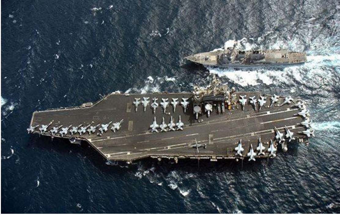
Resim 1: ABD Uçak Gemisi USS Ronald Reagan İran Körfezi'nde

İran askeri gücü, reaktörleri ve fabrikaları genellikle nüfusun yoğun olduğu yerlere konuşlanmıştır. ABD hava taarruzları başarılı olup, İran'ın özellikle uzun menzilli karşı koyma kabiliyetleri yok edildiğinde sıra kara harekâtı için giriş bölgeleri oluşturmaya gelecektir. İran bu dönemde Irak gibi koalisyon kuvvetlerine saldırmayacak ya da savunma pozisyonu almayacaktır. Bunun yerine konvansiyonel olmayan, özel bir savaş (su kaynaklarının yok edilmesi, fabrikaların imhası, zehirli kimyasalların kullanılması, petrol kuyularının patlatılması vb.) başlatılacaktır. İran kuvvetleri küçük, bağımsız gruplar halinde hareket edecek ve ABD derin hava taarruzlarını boşa çıkarmak için üs bölgelerini terk edeceklerdir. İran'ın amacı, ABD zayıflığını artırmak ve koalisyonun dağılmasını sağlayacak kadar kan akıtmak olacaktır. İran kuvvetlerini korumak ve sürpriz konvansiyonel olmayan saldırılar için tarafsız komşu ülkelerin topraklarından da istifade etmeye çalışacaktır. Koalisyon kuvvetleri ülkeyi işgal ettikçe kendini daha fazla gerilla savaşı içinde bulacaktır. İran'ın ümidi ABD ve koalisyonun savaşın sonunda bir zafer olmayacağına inanması ve çatışmaların kolayca ve kısa sürede bitmeyeceğini görmeleridir.